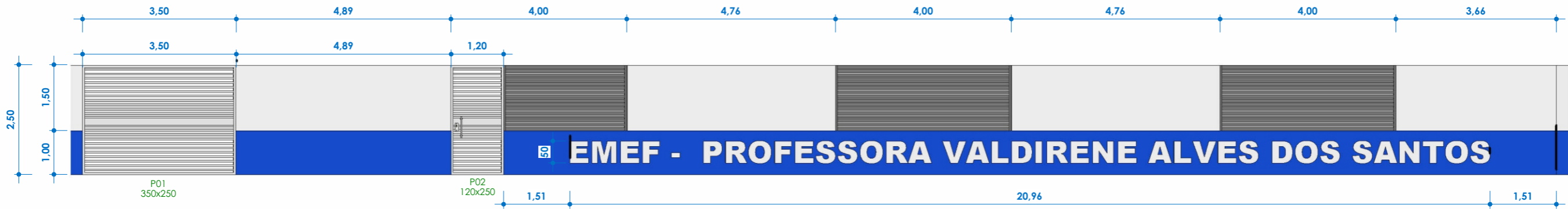
FACHADA VISTA 01 ESC: 1 : 100